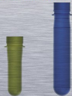
Several sizes with equal neck size