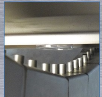
Blowing with clean air