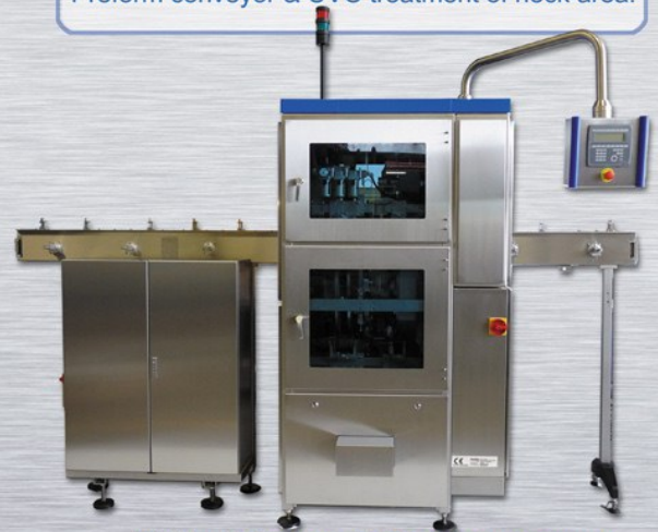
IPWII with horizontal Feedflow conveyor

All Preforms will be turned over 4 times by 360°. Provides additional buffer area with a floor space less than 1.5 m 2 . Available with horizontal Preform conveyor & UVC treatment of neck area.