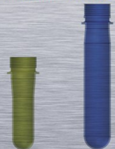
Verschiedene Preformgrößen bei gleichem Neck