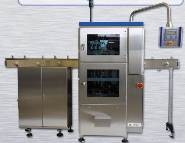
IPWII mit horizontalem Feedflow Fördersystem

Erhältlich mit horizontalem Preform Fördersystem und UVC Behandlung des Neckbereiches.