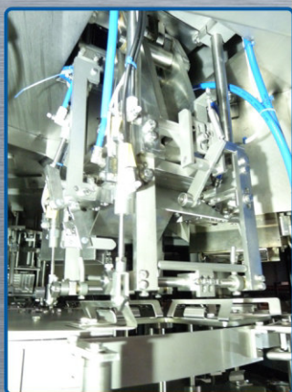
Gable top sealing